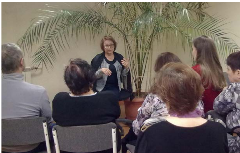
Занятие в Центре профилактики и медико-психологической помощи (г. Вологда)

У созависимых есть риск самим стать зависимыми. Их образ жизни, система взглядов и верований уже почти совпадают со взглядами и установками самих зависимых, и они очень легко могут соскользнуть на тропинку зависимости. Многие созависимые верят, что самый лучший способ сохранять связь с зависимым членом семьи — это употреблять вместе с ним. В конечном счете они сами становятся зависимыми.